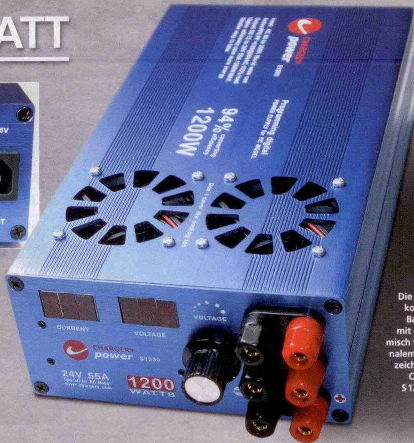
Die äußerst kompakte Bauweise mit ergonomisch funktionalem Design zeichnet das Chargery S 1200 aus.