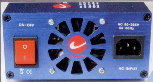
Die Rückseite wird vom Netzanschluss, dem großen Lüfter und dem Netzschalter dominiert.